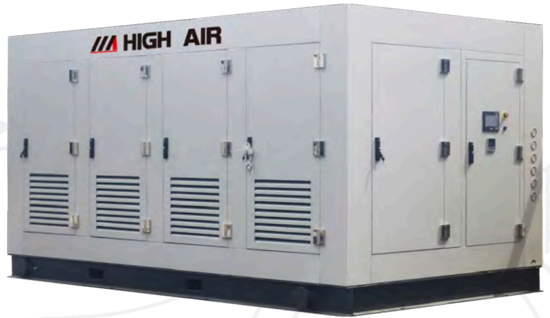
箱体静音型氮气压缩机