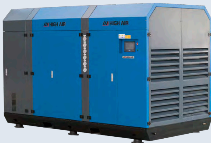
静音型氦气/氩气压缩机系统