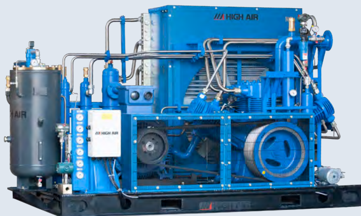
HE系列 流量：200-350Nm 3 /hr 压力：150-350 Bar