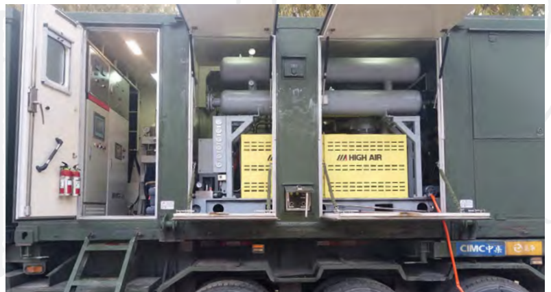
车载氮气回收压缩机